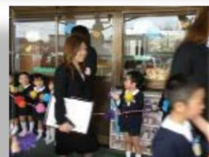
~卒園式~ また逢う日まで。